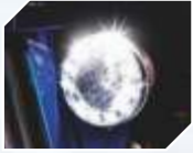
LED DRL हैड लाईट