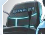
DELUXE सीट / ERGO स्टीयरिंग