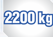
हाई लिफ्ट कॅपेसिटी

दुनिया का नं. 1 हैवी ड्यूटी ट्रैक्टर रेंज