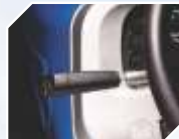
SHUTTLE TECH मल्टी स्पीड एडिशन