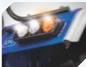
LED टेल लाईट