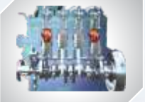
60 HP श्रेणी