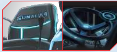
DELUXE सीट एवं ERGO स्टीयरिंग