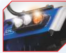
LED टेल लाइट