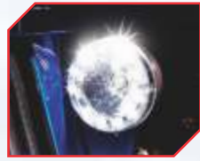
LED DRL हैड लाइट